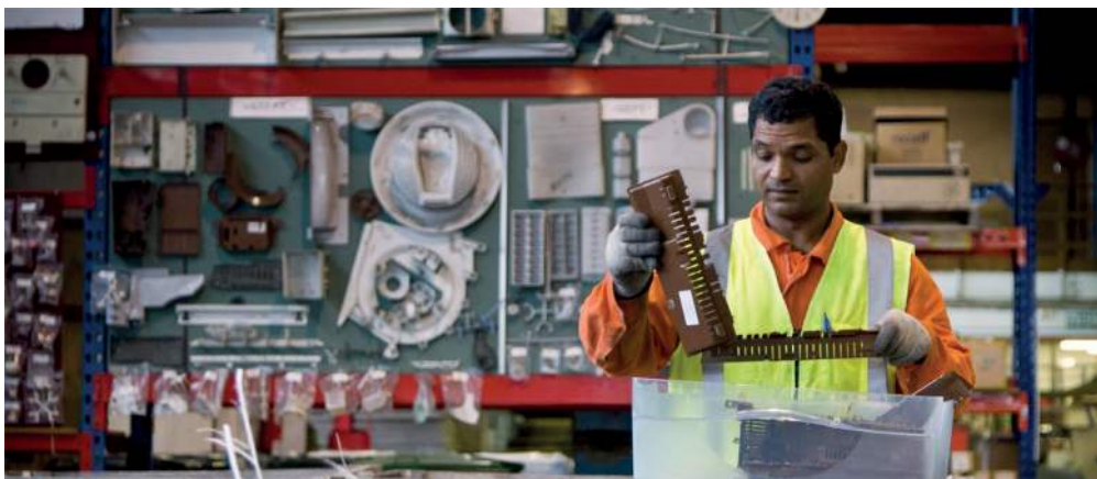
Figura 2: Empleado de Fisher & Paykel Appliances desarmando productos al final de su vida útil

En las Figuras 3 y 4 se muestra un lavaplatos Fisher & Paykel Appliances DishDrawer™. Los dos cajones permiten lavar cargas menores con un menor consumo de agua y energía. La Figura 4 muestra que el coste (costo) de operación anual estimado del lavaplatos Fisher & Paykel es de $30.