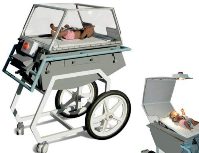
Figura 5: Incubadora NeoNurture