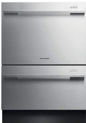
Figura 3: El lavaplatos Fisher & Paykel Appliances DishDrawer™

En las Figuras 3 y 4 se muestra un lavaplatos Fisher & Paykel Appliances DishDrawer™. Los dos cajones permiten lavar cargas menores con un menor consumo de agua y energía. La Figura 4 muestra que el coste (costo) de operación anual estimado del lavaplatos Fisher & Paykel es de $30.