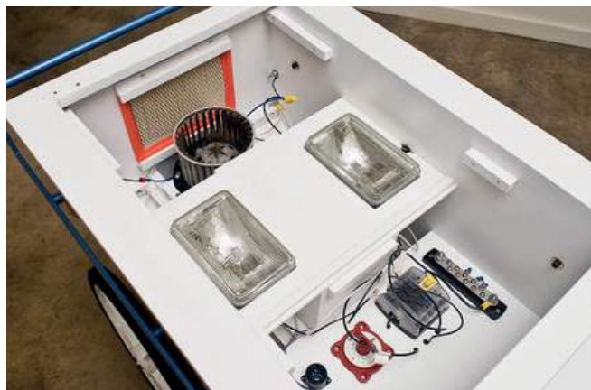
Figura 6: Para el diseño y fabricación de NeoNurture se usan piezas disponibles de vehículos locales