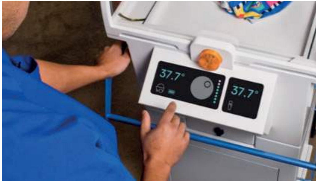
Figura 7: La interfaz de usuario ofrece acceso a los controles de la incubadora NeoNurture y permite definir variables como temperatura y hora