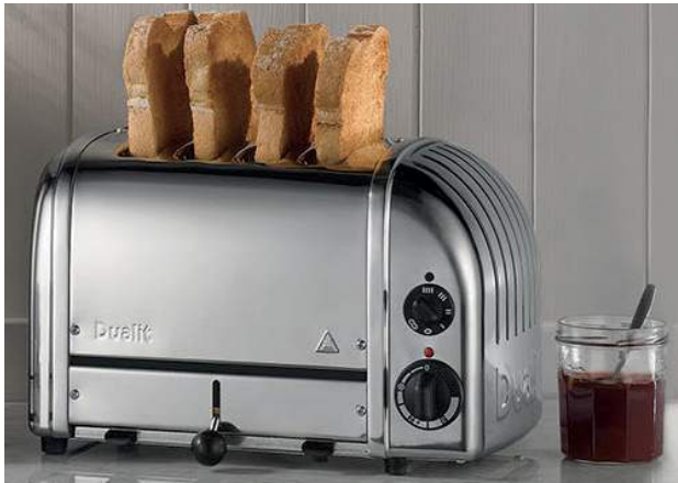
Figura 1: Tostador Dualit original